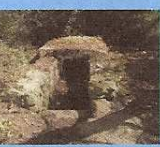
Fontaine du Vran