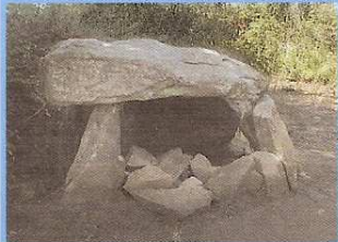
Dolmen de Kerno