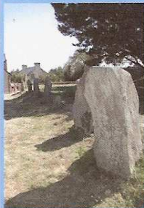
Cromlech de Kergonan