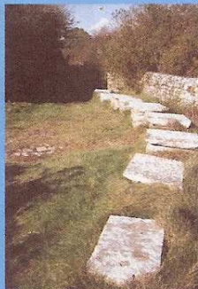
Pierres à laver, Salzen