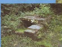
Fontaine du Guip