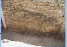
Menhir rue du couvent